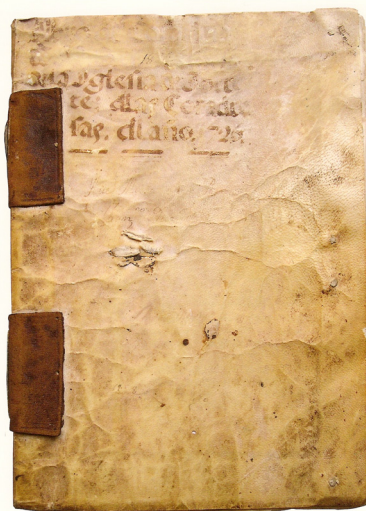
Cubierta en pergamino del Libro de cofrades y de cuentas de la Cofradía del Rosario 1726-1912.

“se tuvo por bien y se determinó que dicha Cofradía del Rosario y la de los Desamparados fuera toda una puesto que hasta ahora no se había hecho acto alguno; por eso, todos unánimes y concordes y ninguno de los susodichos discrepan y representando a toda la Universidad y pueblo de Torrent, determinan como ya estaba determinado, que dichas dos cofradías sean una, y que sea la dicha Cofradía de Nuestra Señora del Rosario”.